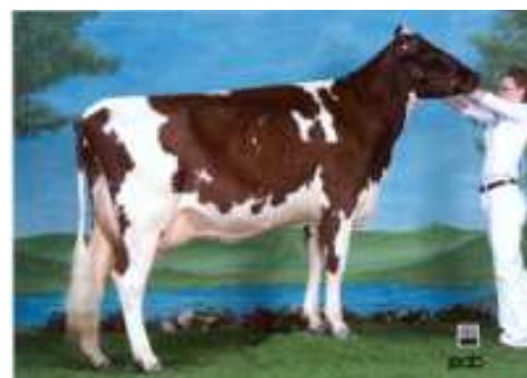
> Claudale Laro KIEUSE