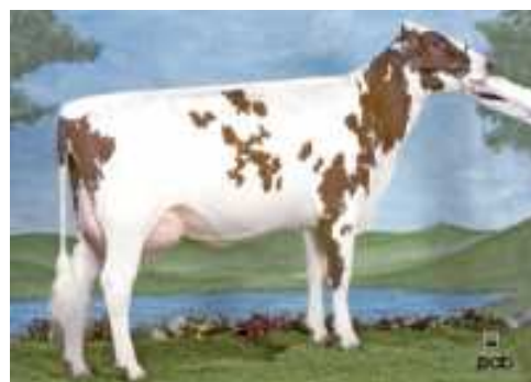
> Soreloise Laro LAURIE TB-88-2Y-CAN