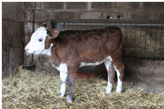
Veau de Excel