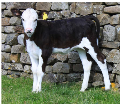
Veau de Ferrari