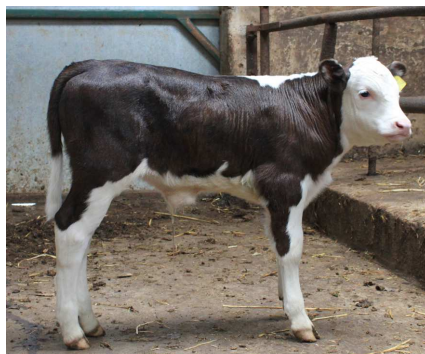
Veau de Ferrari