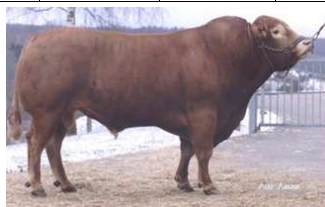
Silverbird (Grand-père paternel)