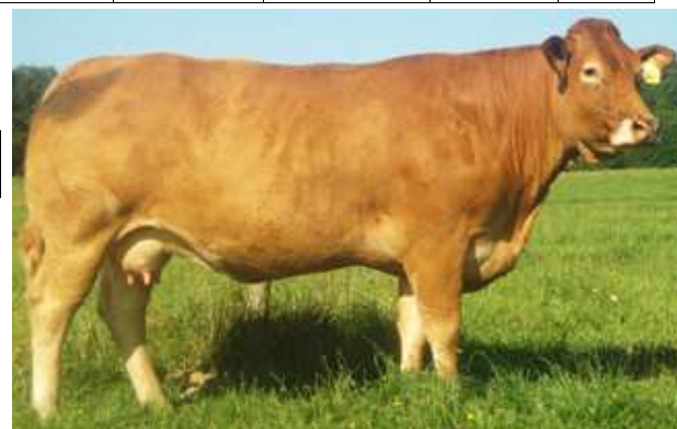
Mère de DON-JUAN