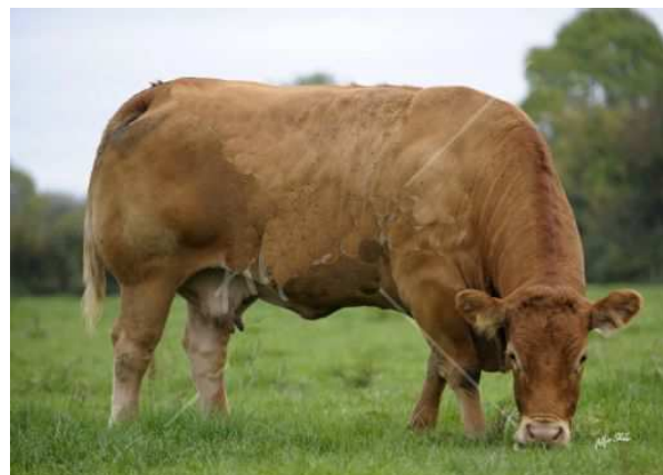
Mère de DAUPHIN