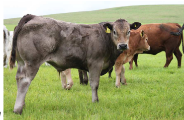
Veau de Dauphin