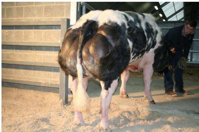
Tigrou de Fermine