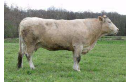
Mère de Valium