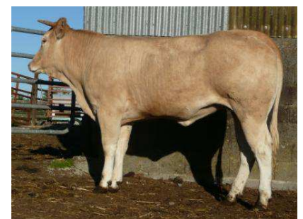
Veau de Valium