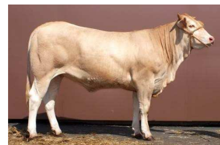
Fille de ELVIS