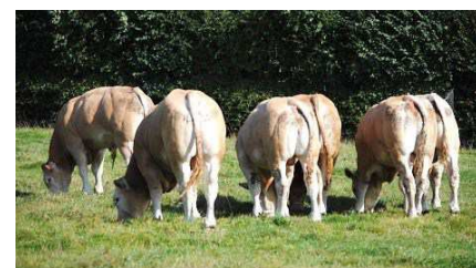
Filles de Fromant