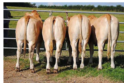
Filles de Fromant