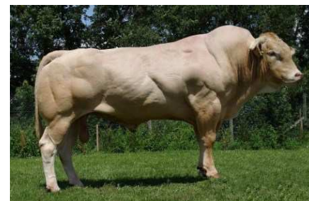
CLIC (père de Indigo)