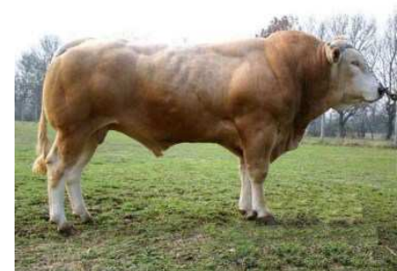
VIDOCK (Grand-père maternel de Indigo)