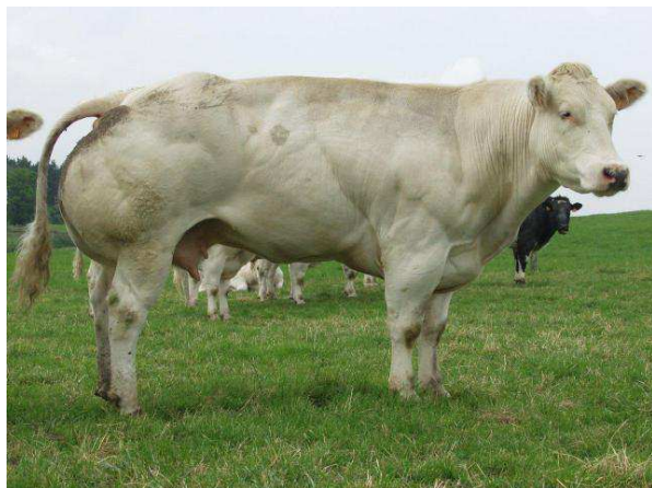
Mère de Nippon