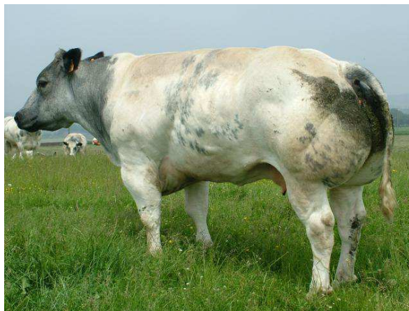
Grand-Mère de Nippon