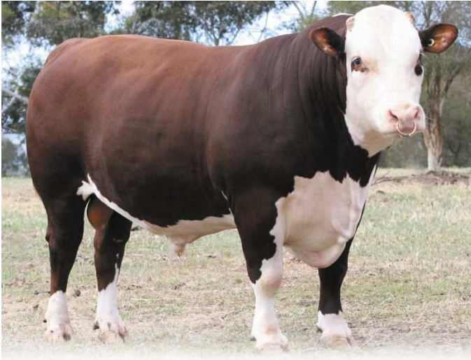
EBV Graph for PINE HILL GLENFERN A595 (AI) (S)