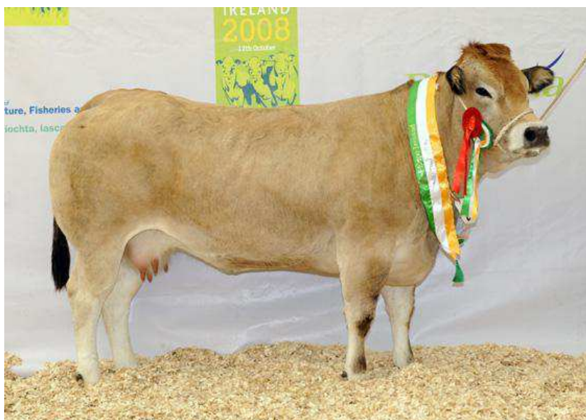
Mère de CAMBRIDGE