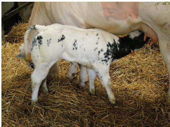
Veau de Nelson